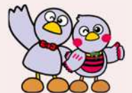
埼玉県のマスコット 「コバトン」「さいたまっち」

※ 交付決定後に対象となる取組を実施し、就業規則の作成又は改正を行う場合が対象となります。